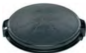
Lock 400 före 1996