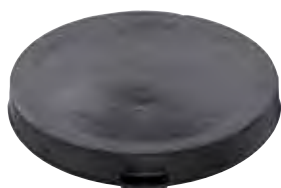
Lock 400 efter 1996