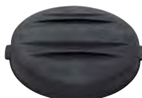
Lock 560 till slamavskiljare efter 2006