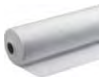
Fiberduk 1,4 x 32 m

Klass: NGS1 Vikt: 110 g/kvadratmeter Vattengenomsläpplighet: 81 l/kvadratmeter