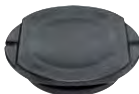
Lock 560 före 2006